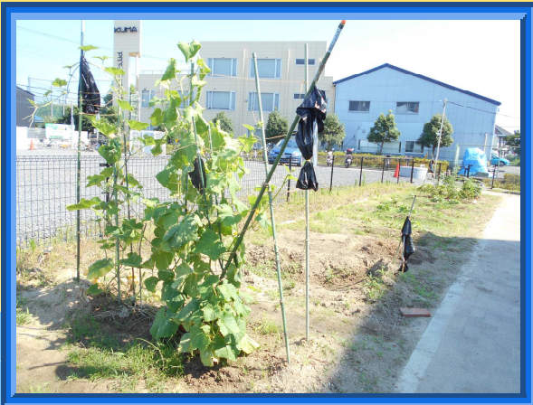
テラス前のゴーヤ

畑の夏野菜が豊作です。毎日オクラの花が咲き、キュウリの苗からカボチャが実りました!