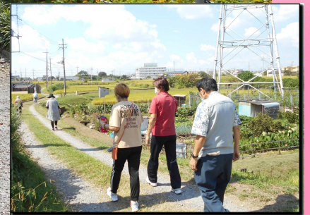
復路は田んぼ道を歩きました。病院が見えています。