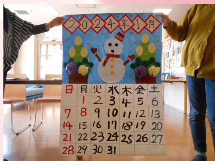
月曜日：カレンダー創作