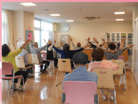
木曜日：体操・軽スポーツ