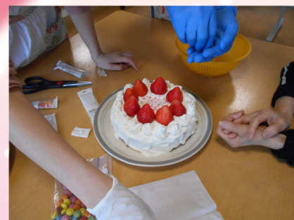
金曜日：おやつ作り